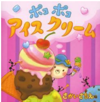
読み聞かせ 「ポコポコアイスクリーム」